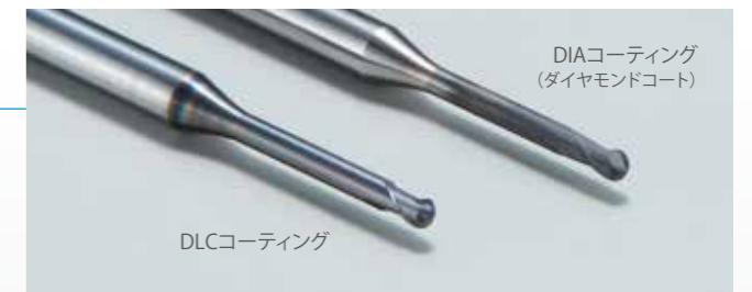
DIAコーティング (ダイヤモンドコート)

新しいコーティング技術を施したミリングバーは低摩擦で優れた潤滑性を有しており、加工による溶着を防ぎます。 従来のDLCコーティングより耐久性が高まり、長寿命を実現しました。