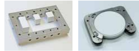
ブロック固定プレート