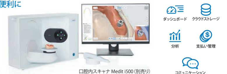
口腔内スキャナ Medit i500 (別売り)

「Medit Link」は、クラウドストレージ機能を備えており、クラウド上でデータのバックアップはもちろん、ラボと医院でデータを共有しワークフローを統合することが可能です。例えば口腔内スキャナで取得したデータは「Medit Link」を通じてラボにも送られ、そのデータをもとに、すぐに技工作業に取りかかることができます。