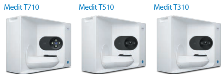
Medit T710 標準価格 2,580,000円 Medit T510 標準価格 1,680,000円 Medit T310 標準価格 980,000円